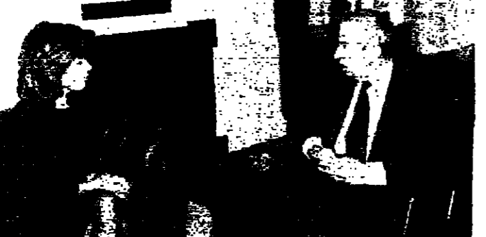
الهراوي مع السيدة معوض (اليمين واليسار)

استقبل الرئيس لياس الهراوي في الايام من بعد ظهر امس ارملة الشهيد الراحل رينه معوض السيدة نائلة معوض التي زارته لشكره على مواساته لها باستشهاده.